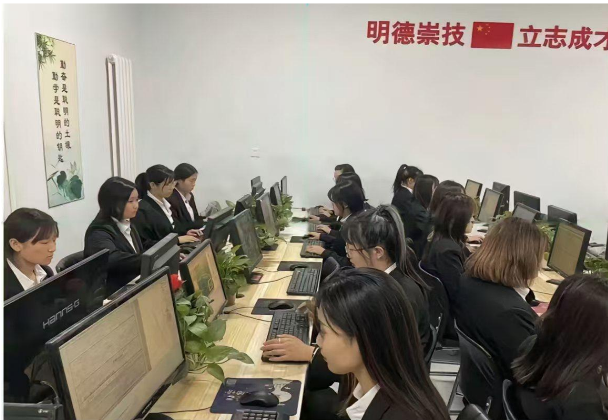
图6 计算机专业学生实训课实践

约”7S管理模式纳入专业管理和教学量化考核标准，使专业文化氛围向企业文化靠拢，促进学生职业素质和职业行为习惯的养成。