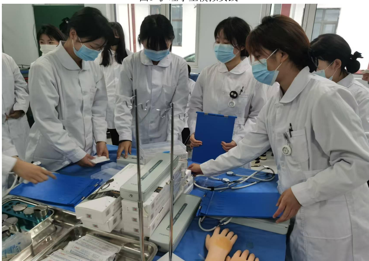
图5 护理学生模拟实践

二是在实训室建立中突出核心素养的培育。依托校外实训基地，采取“循环式”完成实践任务，“主观式”融入理论知识，“梯级式”进行考核评价，有效将课程训练任务在专业实训课程中得到循环体现，学生的核心素养在此过程中得到全面提升。把在实训室中强调的“整理、整顿、清扫、清洁、素养、安全、节