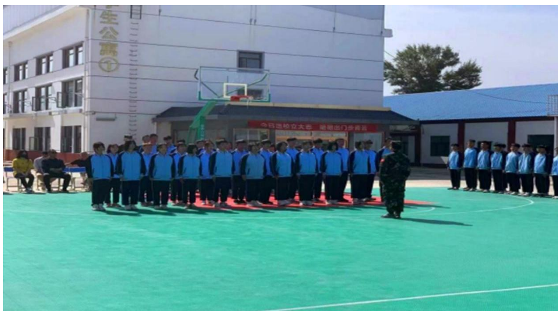
图3：学生爱国教育活动