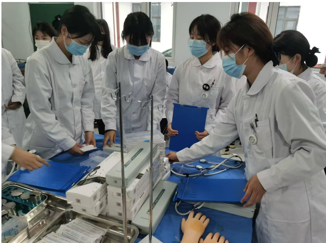
图14 护理班学生实训课模拟实践

宿方面要求企业尽量免费提供。实习时，企业要派专人负责指导学生生产，学校驻厂老师负责学生生活、安全以及学生实习中遇到的偶发事件沟通解决。企业针对学生实行适度的人性管理，对工作时段适当调整，学生工位尽量不分开，车间的班组长对待学生的失误态度要和蔼。驻厂老师要与学生同吃同住，必要时也要到现场陪学生，现场鼓励学生认真实习，并对实习工作中出现的问题进行现场指导。学生实习满期由学校组织考核，考核主要依据是企业对学生的综合评价。学校特别重视受到实习企业奖励的优秀学生，作为典型，进行全面宣传。学生实习效果好、质量高，学校实习工作获学生、家长、企业好评。