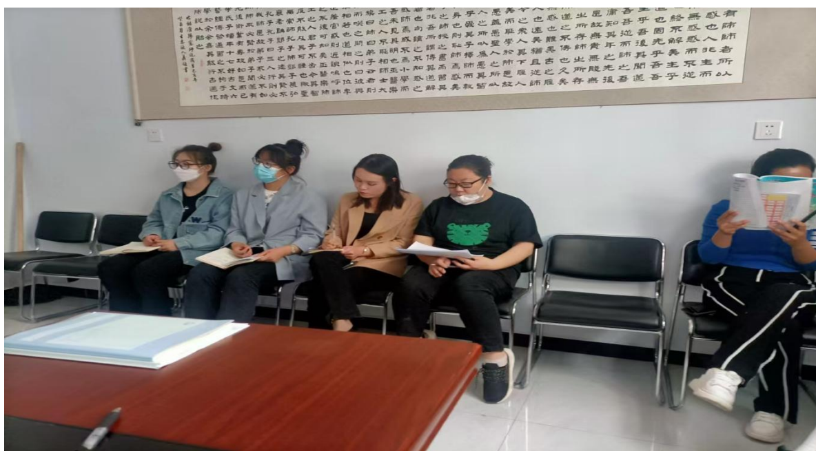
图 9 教师培训