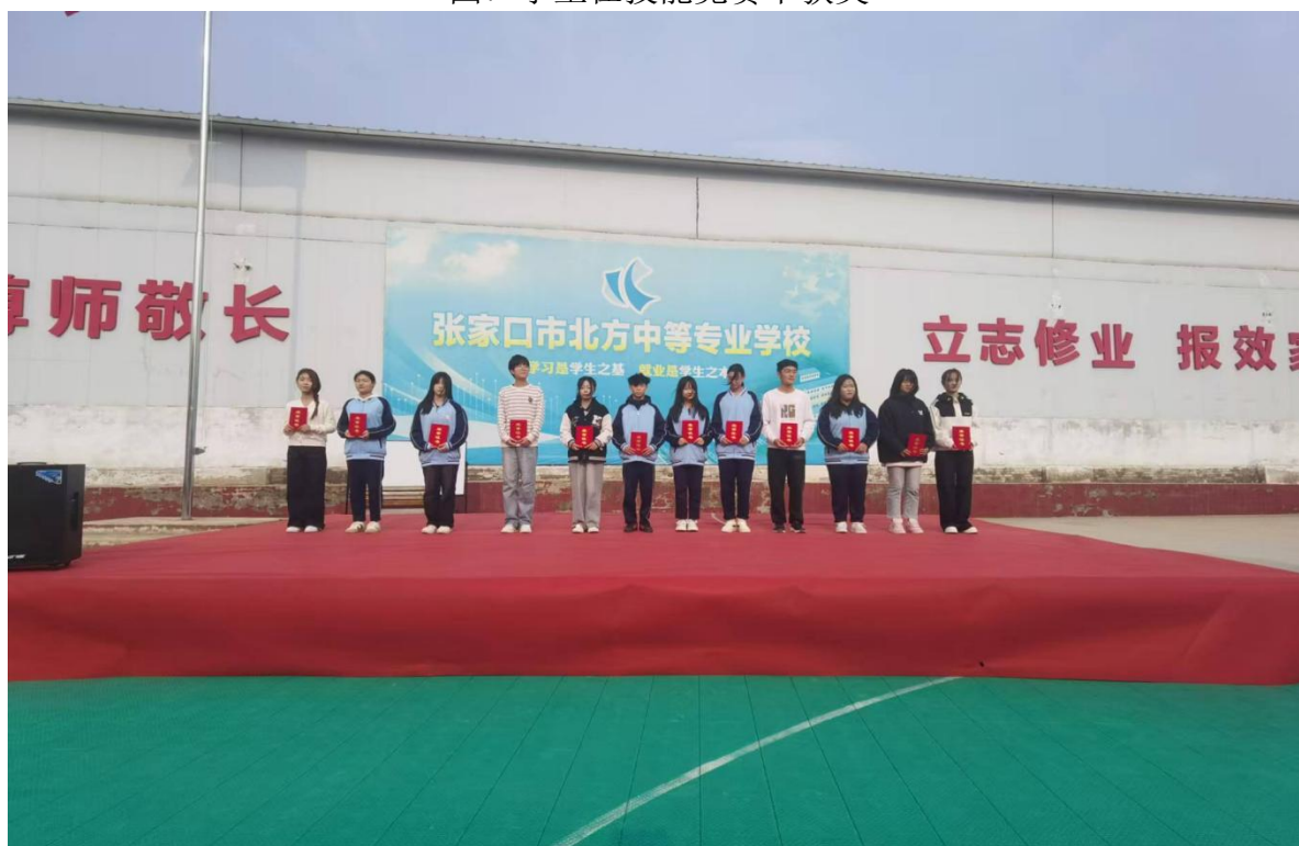
图7 学生在技能竞赛中获奖

积极探索人才培养模式改革。各专业展开充分的企业调研，听取专业建设指导委员会及 校内外专业人士的意见，特别是向用人单位了解、调查各种职业岗位对知识结构 的实际要求，制定人才培养方案。在此基础上，坚持校企合作、工学交替、顶岗实习的人才培养模式。积极推进校企合作，加强实践环节，与一