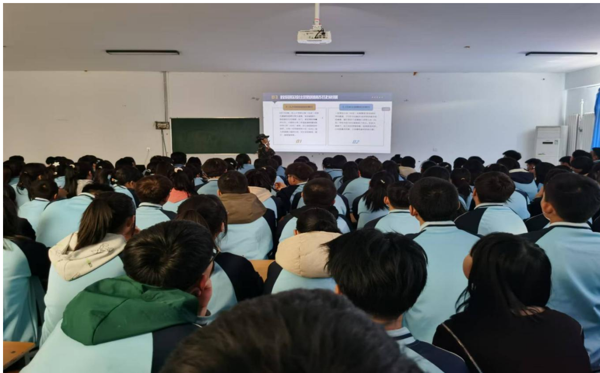
图 8 多媒体投影设备宣传校园安全