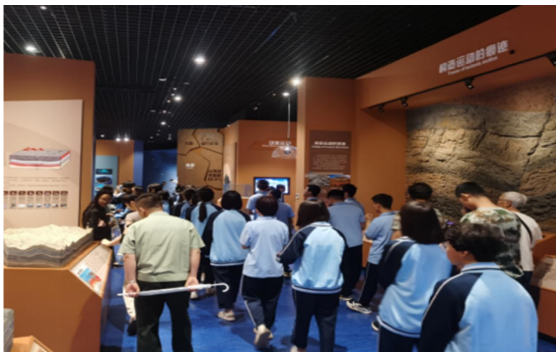
图 13 学生博物馆研学